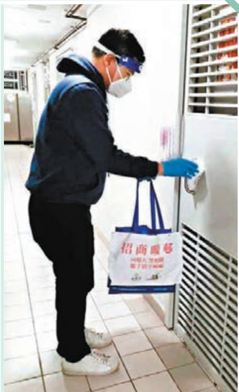
▲招商局員工深入社區支持抗疫。受訪者供圖

商經局發言人表示,工作小組會繼續檢視情況,因應各抗疫部門的需要,透過內地專班採購更多醫療物資,全力以赴,對抗疫情。