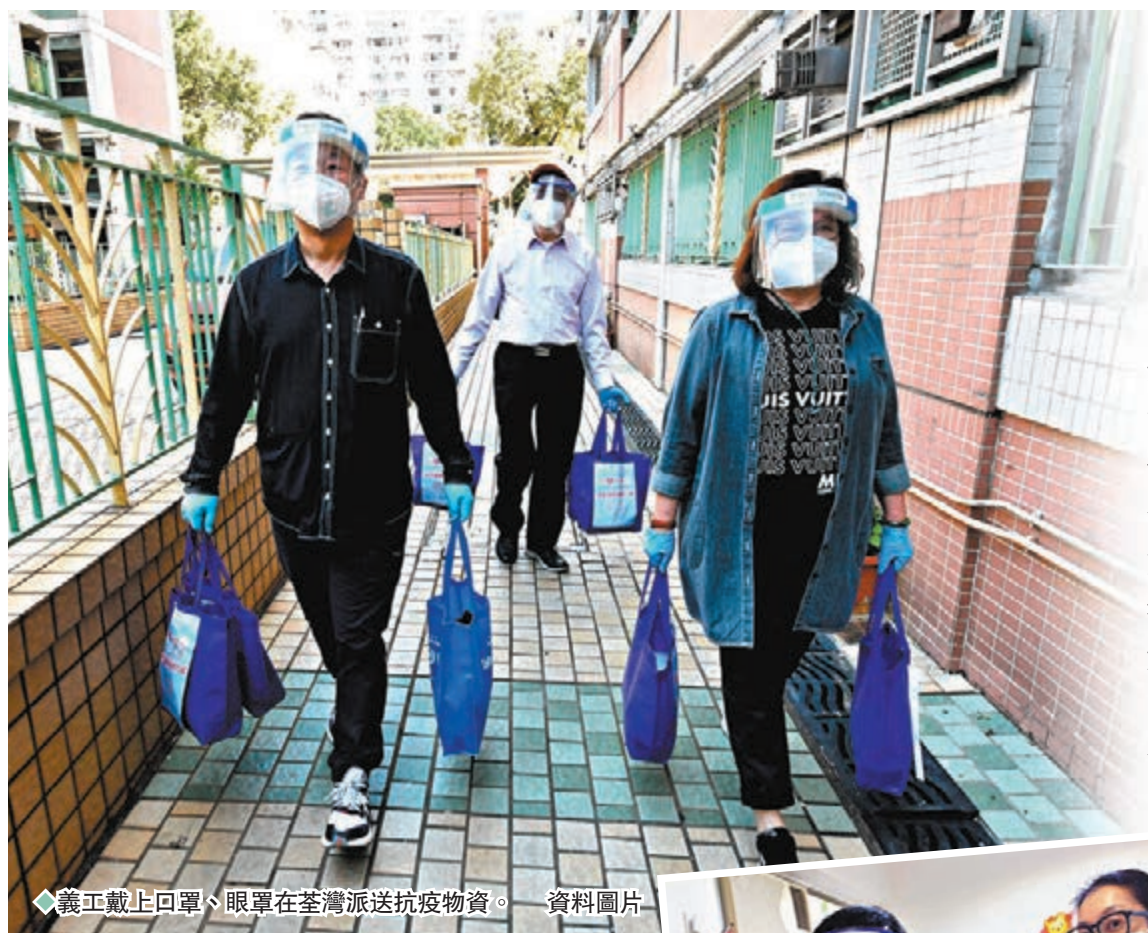
義工戴上口罩、眼罩在荃灣派送抗疫物資。